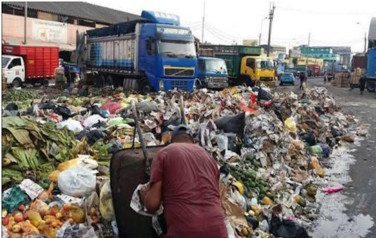
Desmante de basura mercado de frutas del Distrito de La Victoria