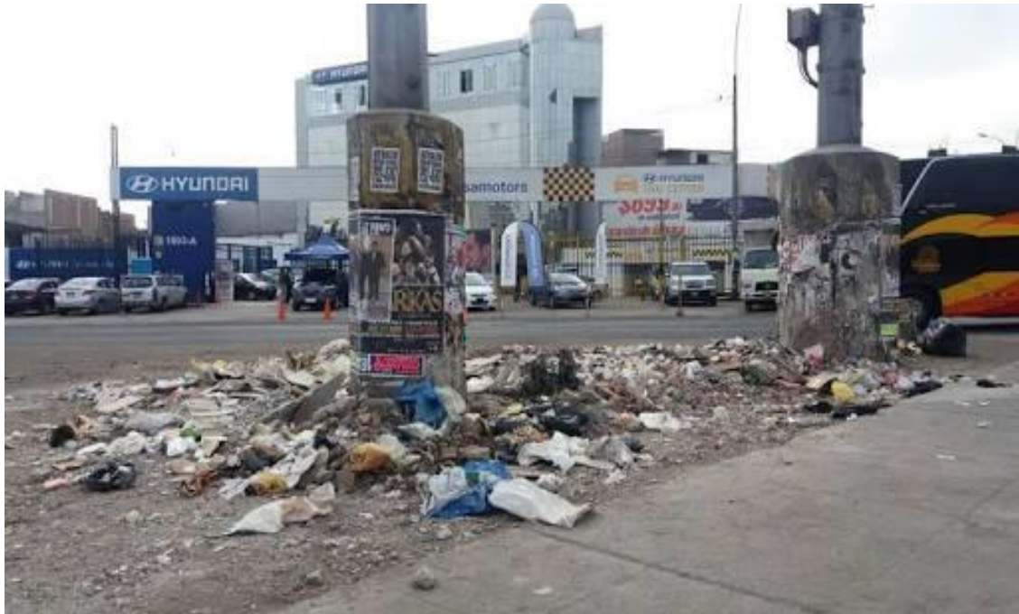
Acumulación de basura en la avenida Nicolás Arriola del Distrito de La Victoria